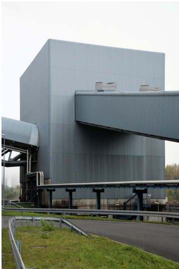
Kraftwerk Neurath (Neuanlage): Eisenaushaltung (Eisenausscheidung), Ansicht von Südosten; Foto: 23.10.2023