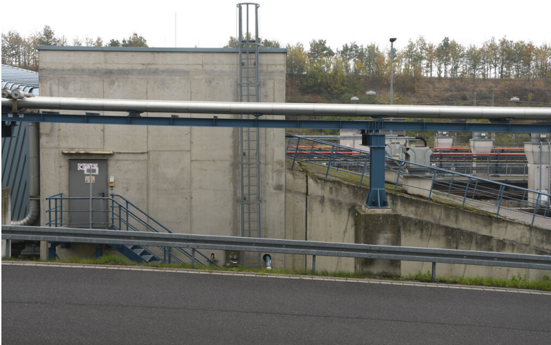
Kraftwerk Neurath (Neuanlage): Kanal zur Eisenaushaltung, Ansicht von Süden; Foto: 23.10.2023