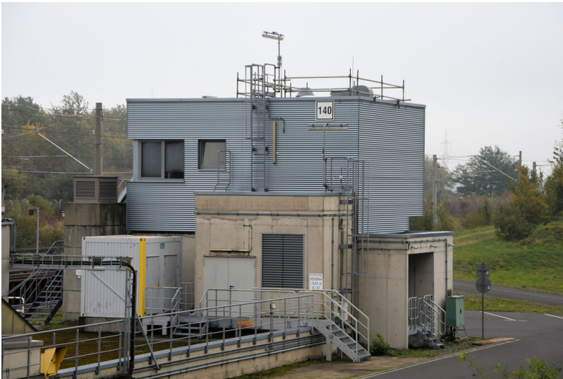
Kraftwerk Neurath (Neuanlage): Kohleverteilgebäude Schlitzbunker, Ansicht von Südwesten; Foto: 23.10.2023