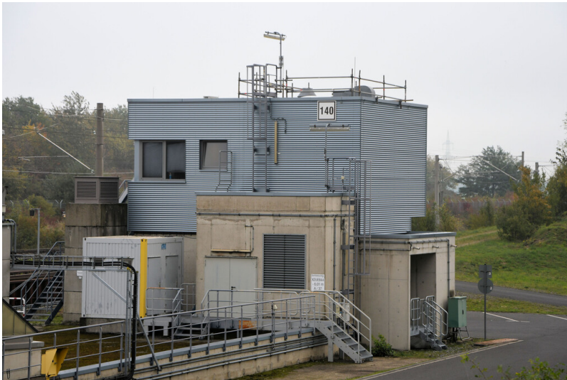
Kraftwerk Neurath (Neuanlage): Kohleverteilgebäude Schlitzbunker, Ansicht von Südwesten