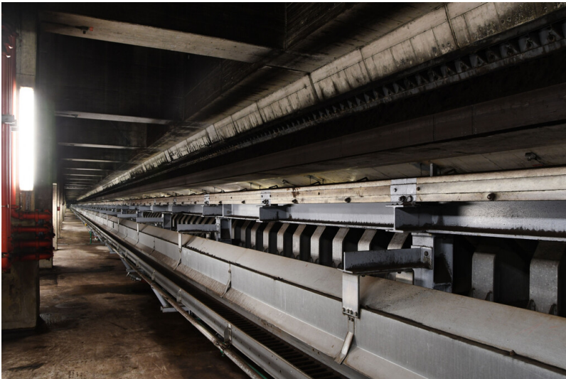
Kraftwerk Neurath (Neuanlage): Schlitzbunker, Bunkerschiff mit Kohleabzugsband, Innenansicht