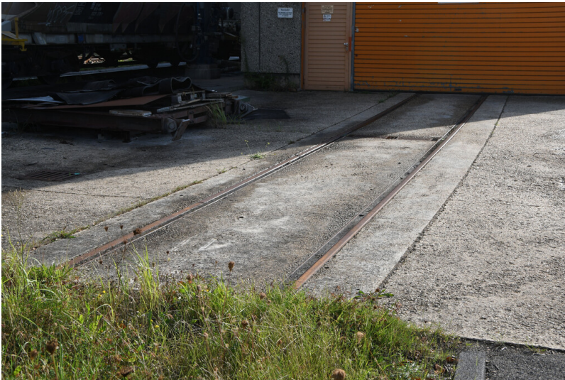
Kraftwerk Neurath: Zufahrtsgleis zum Lokschuppen, erhaltener Abschnitt vor der Lokschuppeneinfahrt, Ansicht von Westen; Foto: 12.09.2023