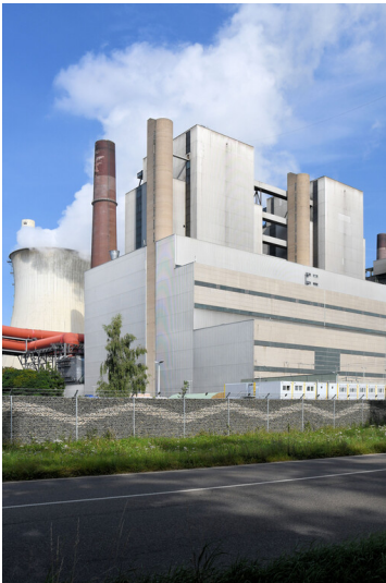
Kraftwerk Neurath: Treppen- und Aufzugtürme mit den Kesselhäusern der Blöcke D (rechts) und E, Ansicht von Südwesten