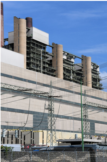
Kraftwerk Neurath: Treppen- und Aufzugtürme der Blöcke A (rechts), B und C, Ansicht von Südwesten