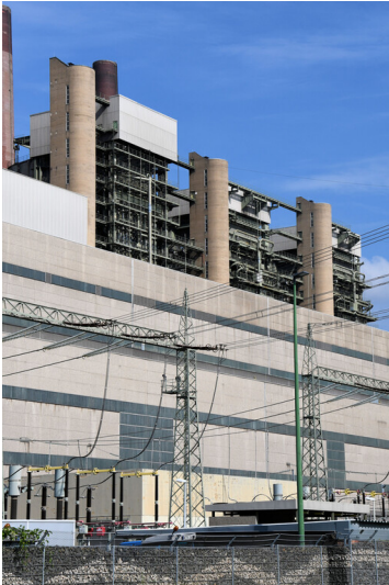
Kraftwerk Neurath: Treppen- und Aufzugtürme der Blöcke A (rechts), B und C, Ansicht von Südwesten