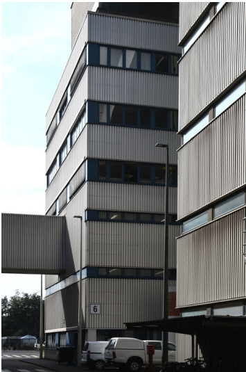
Kraftwerk Neurath: Multifunktionsgebäude, Ansicht von Nordosten; Foto: 12.09.2023