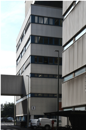
Kraftwerk Neurath: Multifunktionsgebäude, Ansicht von Nordosten; Foto: 12.09.2023