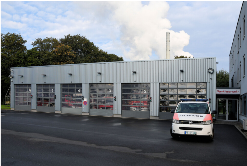
Kraftwerk Neurath: Neue Feuerwache, Fahrzeughalle, Ansicht von Südosten; Foto: 12.09.2023