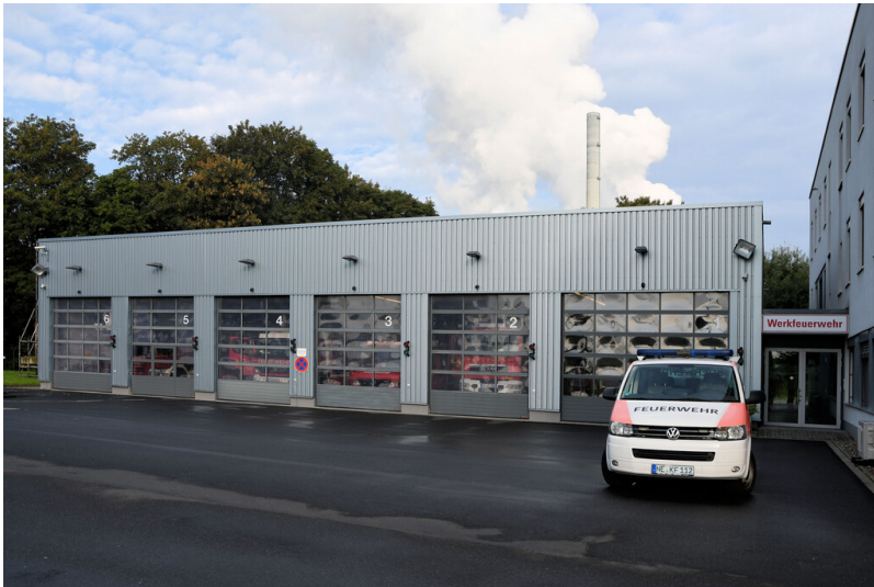
Kraftwerk Neurath: Neue Feuerwache, Fahrzeughalle, Ansicht von Südosten; Foto: 12.09.2023