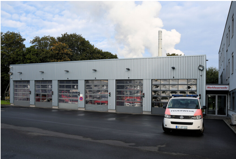
Kraftwerk Neurath: Neue Feuerwache, Fahrzeughalle, Ansicht von Südosten; Foto: 12.09.2023