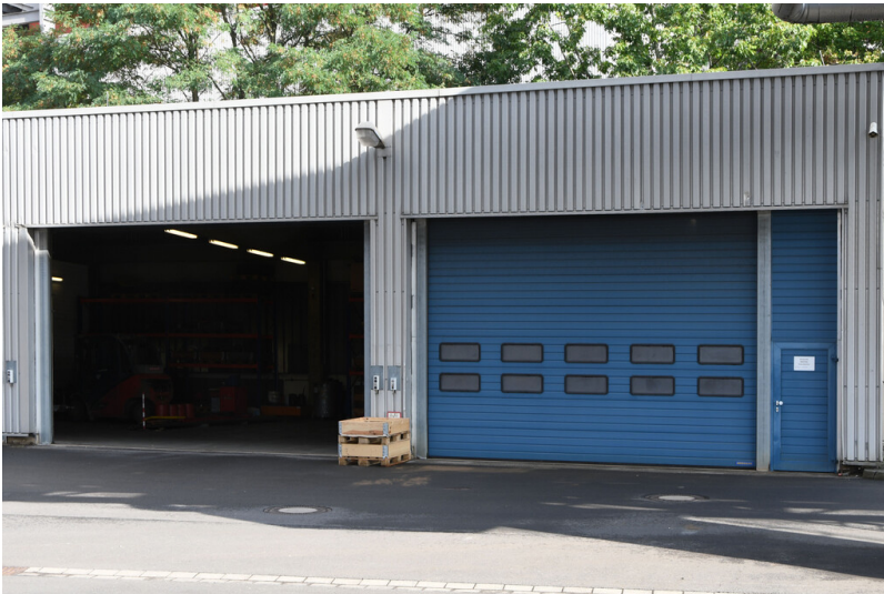
Kraftwerk Neurath: Feuerwache, Gebäudedetail Garagen, Ansicht von Süden; Foto: 12.09.2023