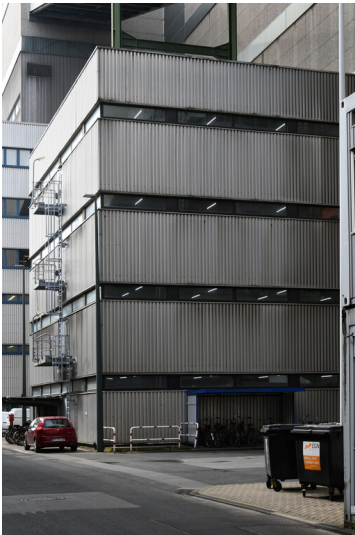
Kraftwerk Neurath: Waschkaue A/C, Ansicht von Nordosten; Foto: 12.09.2023