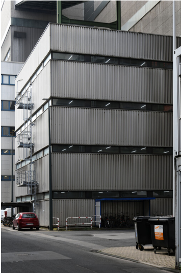
Kraftwerk Neurath: Waschkaue A/C, Ansicht von Nordosten; Foto: 12.09.2023