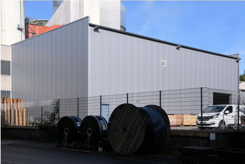
Kraftwerk Neurath: Freilager, Hallenbau, Ansicht von Südosten