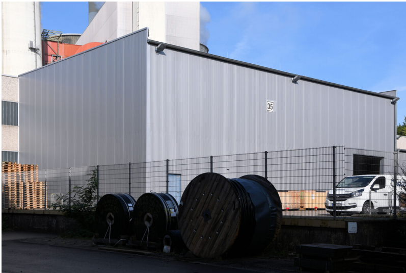
Kraftwerk Neurath: Freilager, Hallenbau, Ansicht von Südosten; Foto: 12.09.2023