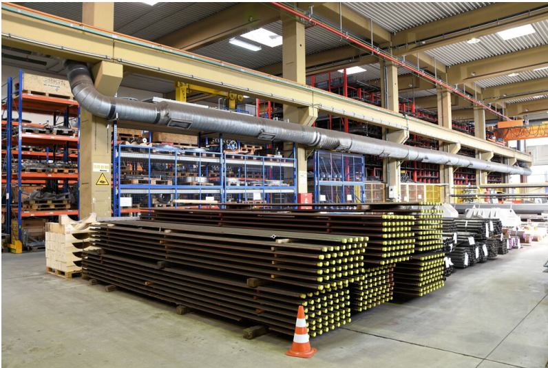
Kraftwerk Neurath: Lagerhalle (Magazin), Innenansicht; Foto: 12.09.2023