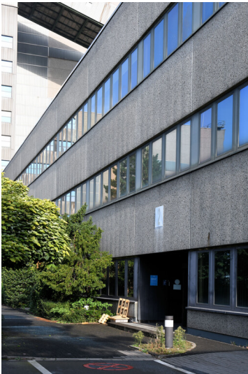
Kraftwerk Neurath: Verwaltungs-/Werkstattgebäude, Verwaltungstrakt, Eingang, Ansicht von Südosten