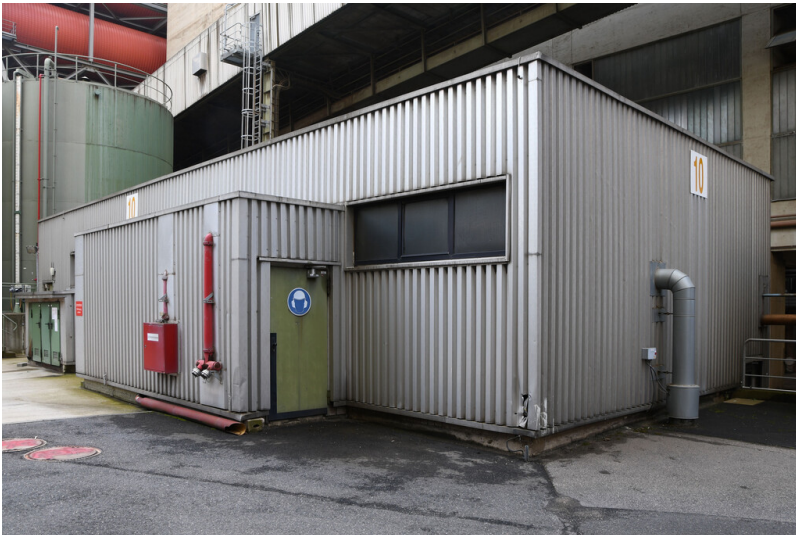
Kraftwerk Neurath: Zündölpumpenhaus, Ansicht von Nordwesten