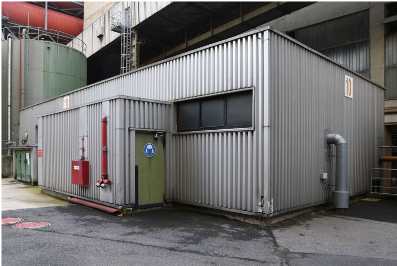
Kraftwerk Neurath: Zündölpumpenhaus, Ansicht von Nordwesten