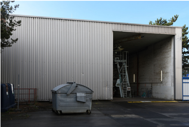
Kraftwerk Neurath: Pumpenhaus, automatische Rechenanlage, Ansicht von Nordosten; Foto: 12.09.2023