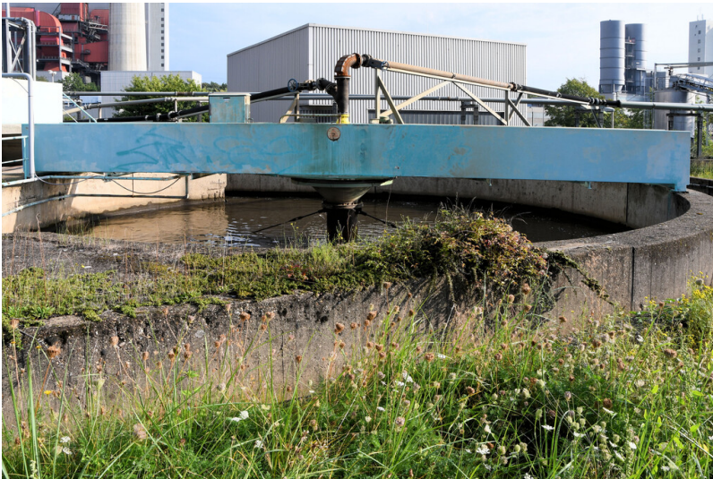
Kraftwerk Neurath: Sandfang 1, Aufhängung des Krählerwerks, Ansicht von Südwesten