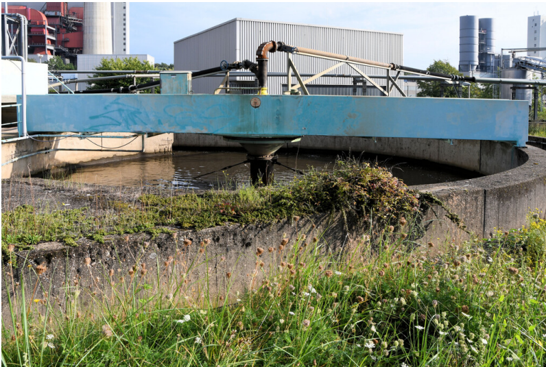
Kraftwerk Neurath: Sandfang 1, Aufhängung des Krählwerks, Ansicht von Südwesten