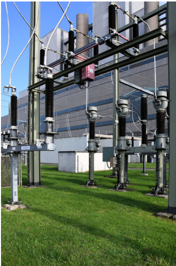
Kraftwerk Neurath: 110-kV-Allgemeinanlage 1, Schaltfeld (Trennschalter, Wandler, Leistungsschalter) für die Einführung der 110-kV-Freileitung "Krahwinkel-Süd", Ansicht von Südosten