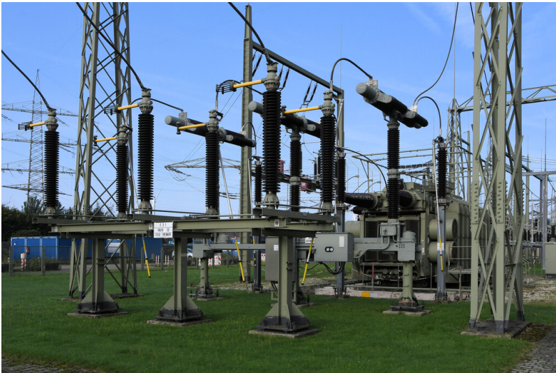
Kraftwerk Neurath: 220-kV-Schaltfeld von Transformator 23, Trenn- und Leistungsschalter, Ansicht von Osten; Foto: 14.09.2023