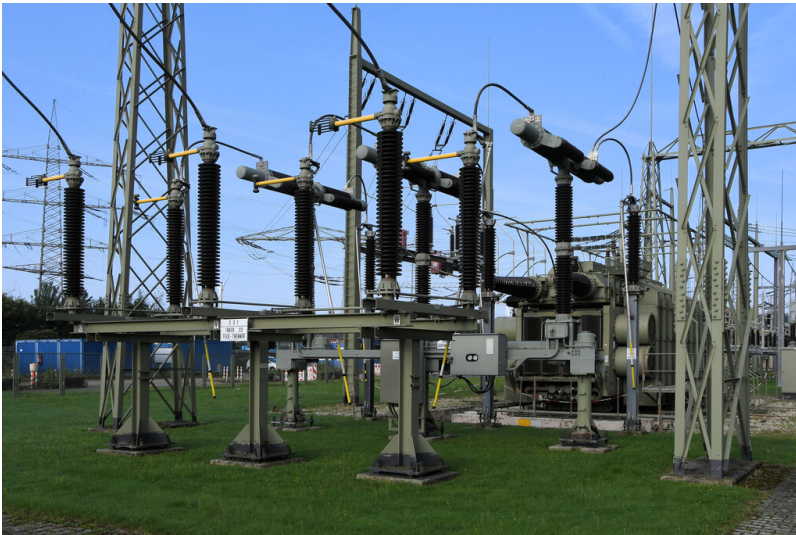
Kraftwerk Neurath: 220-kV-Schaltfeld von Transformator 23, Trenn- und Leistungsschalter, Ansicht von Osten; Foto: 14.09.2023