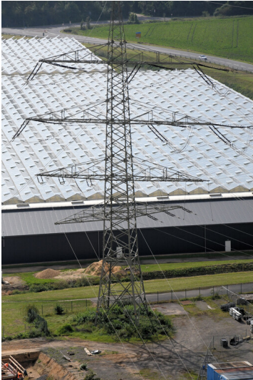
Kraftwerk Neurath: Abspannmast 1 (Bl-Nr. 4585) mit Aufnahme der Leitungsseile der Hochspannungsleitung "Neurath 1a", Ansicht von Nordosten; Foto: 14.09.2023