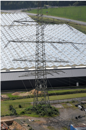
Kraftwerk Neurath: Abspannmast 1 (Bl-Nr. 4585) mit Aufnahme der Leitungsseile der Hochspannungsleitung "Neurath 1a", Ansicht von Nordosten