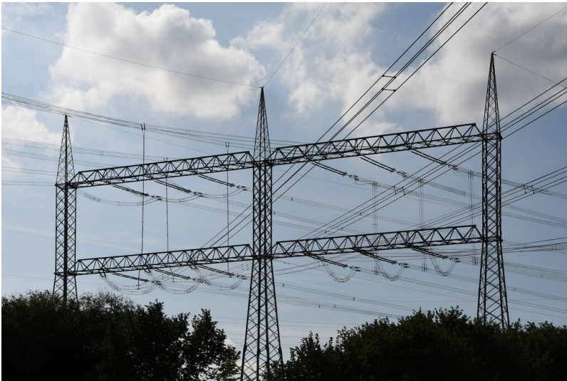
Kraftwerk Neurath: Freileitungsabgang Block E, Führung der Leitungsseile (Viererbündel) auf Abspannportal M 2 (rechte Seite), Ansicht von Osten; Foto: 12.09.2023