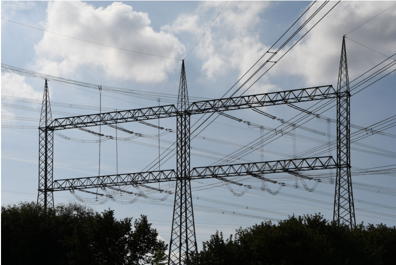
Kraftwerk Neurath: Freileitungsabgang Block E, Führung der Leitungsseile (Viererbündel) auf Abspannportal M 2 (rechte Seite), Ansicht von Osten; Foto: 12.09.2023