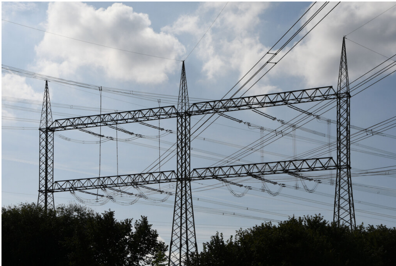
Kraftwerk Neurath: Freileitungsabgang Block E, Führung der Leitungsseile (Viererbündel) auf Abspannportal M 2 (rechte Seite), Ansicht von Osten