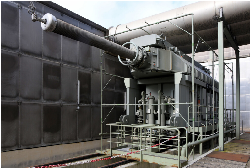
Kraftwerk Neurath: einphasiger Maschinentransformatorpol (21/420 kV, 267 MVA), Phase U (Baujahr 1971) von Block E, Ansicht von Osten