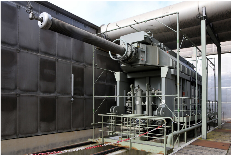
Kraftwerk Neurath: einphasiger Maschinentransformatorpol (21/420 kV, 267 MVA), Phase U (Baujahr 1971) von Block E, Ansicht von Osten