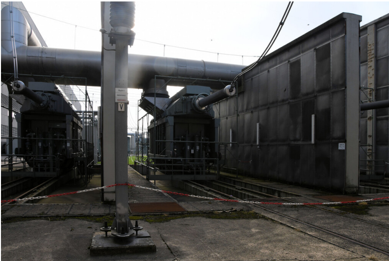
Kraftwerk Neurath: Maschinentransformatorpol (21/420 kV, 267 MVA), Phase V (Mitte) und U von Block D, Ansicht von Westen