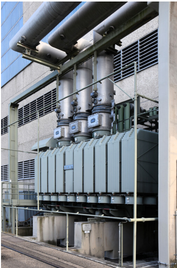
Kraftwerk Neurath: REA-Transformator Block A (21/10 kV, 45 MVA; Baujahr um 1986), Ansicht von Südosten; Foto: 14.09.2023