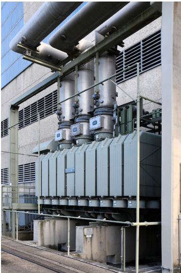
Kraftwerk Neurath: REA-Transformator Block A (21/10 kV, 45 MVA; Baujahr um 1986), Ansicht von Südosten; Foto: 14.09.2023