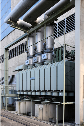
Kraftwerk Neurath: REA-Transformator Block A (21/10 kV, 45 MVA; Baujahr um 1986), Ansicht von Südosten; Foto: 14.09.2023