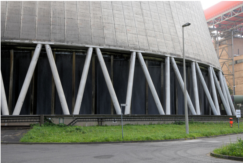
Kraftwerk Neurath: Kühlturm Block E, Kühlturmtasse und Schrägstreben, Ansicht von Osten; Foto: 12.09.2023