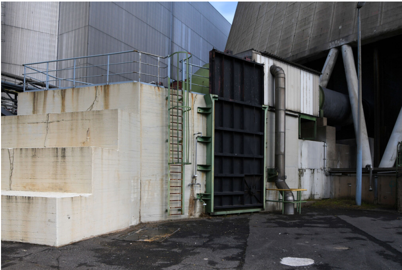
Kraftwerk Neurath: Kühlturm Block D, Kühlwassereinlauf und -auslauf, Ansicht von Südosten; Foto: 12.09.2023