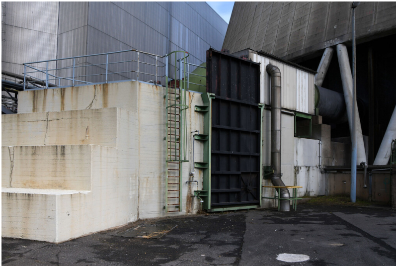
Kraftwerk Neurath: Kühlturm Block D, Kühlwassereinlauf und -auslauf, Ansicht von Südosten