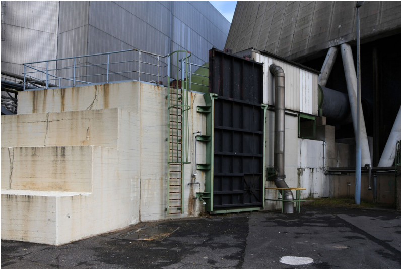
Kraftwerk Neurath: Kühlturm Block D, Kühlwassereinlauf und -auslauf, Ansicht von Südosten; Foto: 12.09.2023