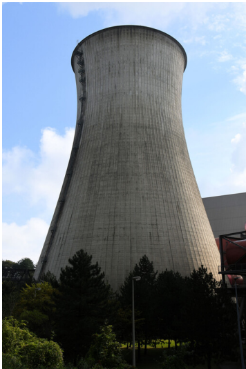
Kraftwerk Neurath: Kühlturm Block B, Ansicht von Nordwesten; Foto: 12.09.2023