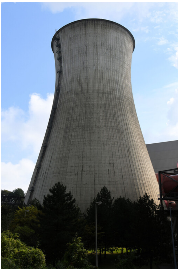
Kraftwerk Neurath: Kühlturm Block B, Ansicht von Nordwesten; Foto: 12.09.2023