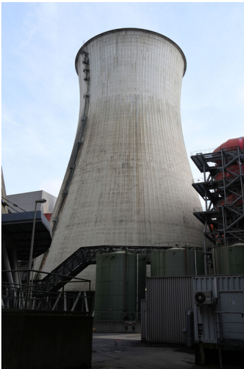
Kraftwerk Neurath: Kühlturm Block A, Ansicht von Westen