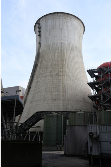
Kraftwerk Neurath: Kühlturm Block A, Ansicht von Westen; Foto: 12.09.20233