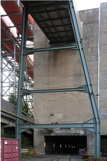
Kraftwerk Neurath: Aschebunker D/E, Bunkerteil für Nassasche, Ansicht von Westen; Foto: 12.09.2023