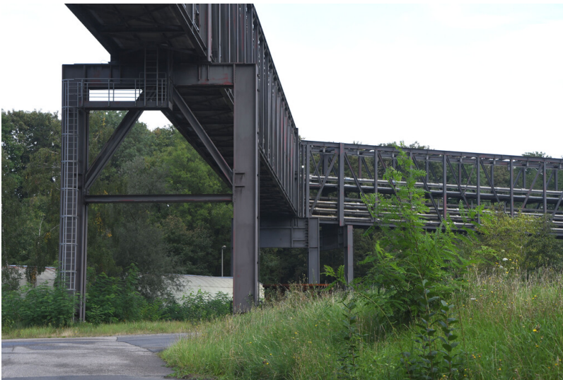
Kraftwerk Neurath: Rohrbrücke zur Führung der Gipsförderleitungen vor dem Gipsentwässerungsgebäude, Ansicht von Süden; Foto: 12.09.2023