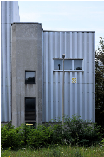
Kraftwerk Neurath: Schaltanlage Gipsbehandlung, Nordfassade und Treppenhausturm, Ansicht von Norden; Foto: 12.09.2023