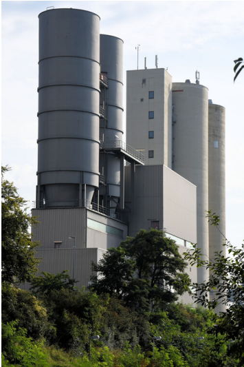
Kraftwerk Neurath: Kalk-Anlage mit den Kalksilos, Ansicht von Südwesten; Foto: 12.09.2023