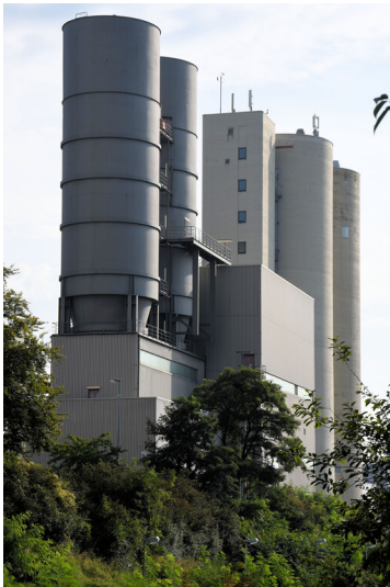
Kraftwerk Neurath: Kalk-Anlage mit den Kalksilos, Ansicht von Südwesten; Foto: 12.09.2023