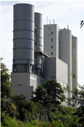
Kraftwerk Neurath: Kalk-Anlage mit den Kalksilos, Ansicht von Südwesten