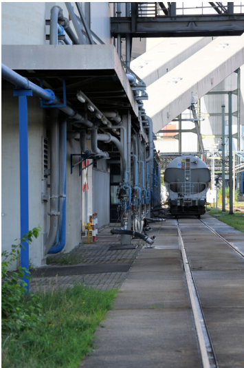
Kraftwerk Neurath: Kalkbahnhof, Ansicht von Osten; Foto: 12.09.2023