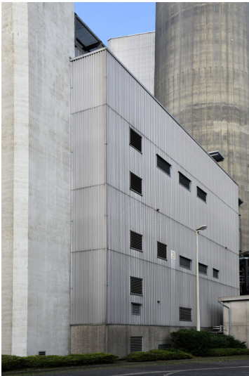
Kraftwerk Neurath: REA-Schaltanlage D/E, Ansicht von Südosten; Foto: 12.09.2023