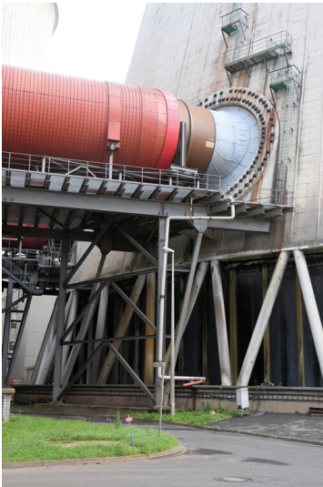
Kraftwerk Neurath: Reingaseinleitung Kühlturm E, Ansicht von Westen; Foto: 12.09.2023