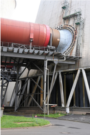
Kraftwerk Neurath: Reingaseinleitung Kühlturm E, Ansicht von Westen; Foto: 12.09.2023