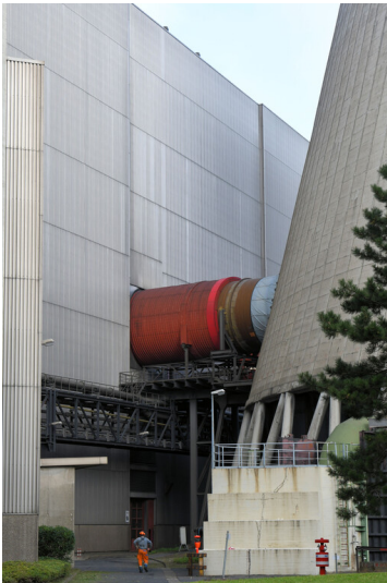
Kraftwerk Neurath: Reingaseinleitung Kühlturm D, Ansicht von Süden; Foto: 12.09.2023