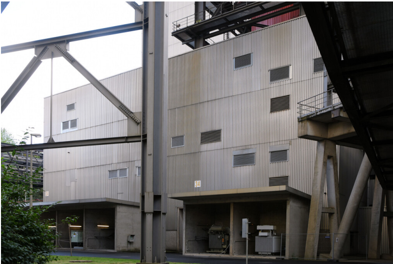
Kraftwerk Neurath: REA-Schaltanlage A/C, Ansicht von Westen; Foto: 12.09.2023