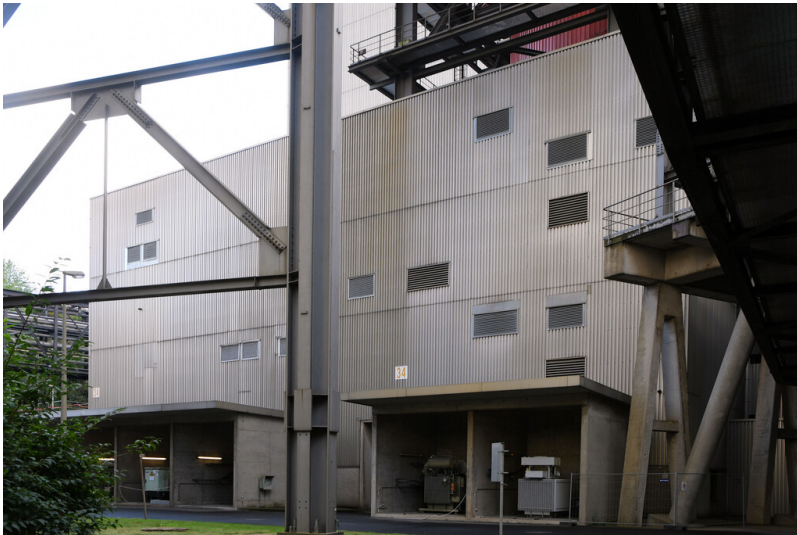
Kraftwerk Neurath: REA-Schaltanlage A/C, Ansicht von Westen