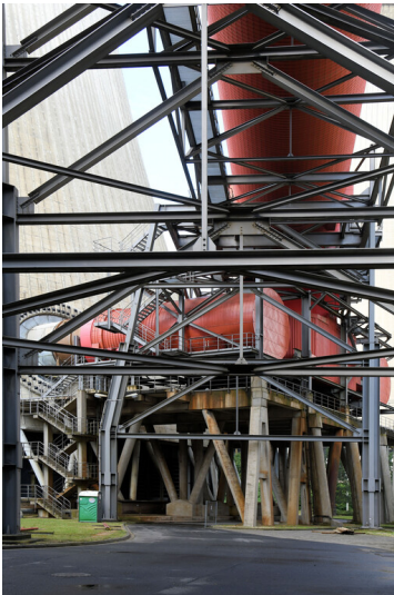
Kraftwerk Neurath: Reingaseinleitung Kühlturm C, Führung des Reingaskanals zum Kühlturm, Ansicht von Osten