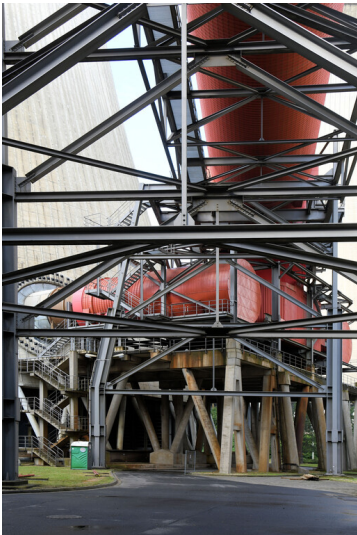
Kraftwerk Neurath: Reingaseinleitung Kühlturm C, Führung des Reingaskanals zum Kühlturm, Ansicht von Osten; Foto: 12.09.2023