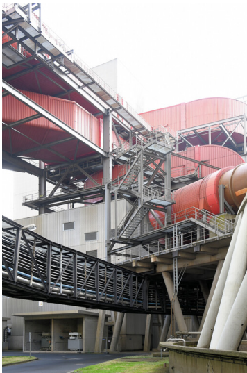
Kraftwerk Neurath: Reingaseinleitung Kühlturm A, Reingasrohr vor Einleitung in den Kühlturm (rechts im Bild), Ansicht von Westen; Foto: 12.09.2023