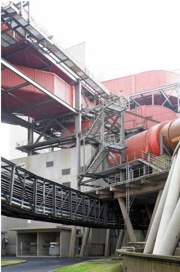
Kraftwerk Neurath: Reingaseinleitung Kühlturm A, Reingasrohr vor Einleitung in den Kühlturm (rechts im Bild), Ansicht von Westen; Foto: 12.09.2023