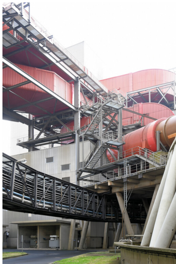
Kraftwerk Neurath: Reingaseinleitung Kühlturm A, Reingasrohr vor Einleitung in den Kühlturm (rechts im Bild), Ansicht von Westen