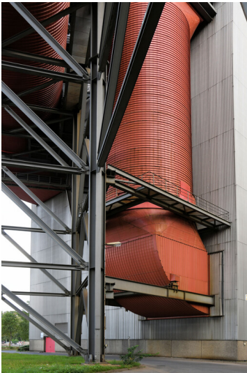
Kraftwerk Neurath: Absorbergebäude E, Einführung von Rohgaskanälen, Ansicht von Südwesten; Foto: 12.09.2023