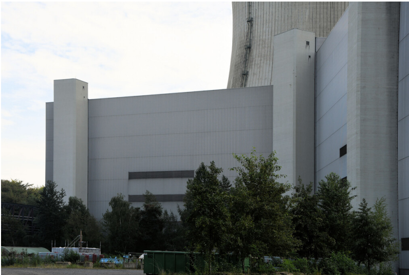
Kraftwerk Neurath: Absorbergebäude D, Ansicht von Westen; Foto: 12.09.2023