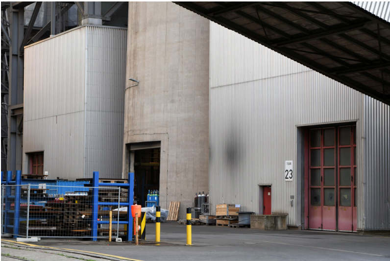
Kraftwerk Neurath: Schornstein Block E, Stahlbeton-Fundamentsockel mit Einfahrt, Ansicht von Nordwesten; Foto: 12.09.2023