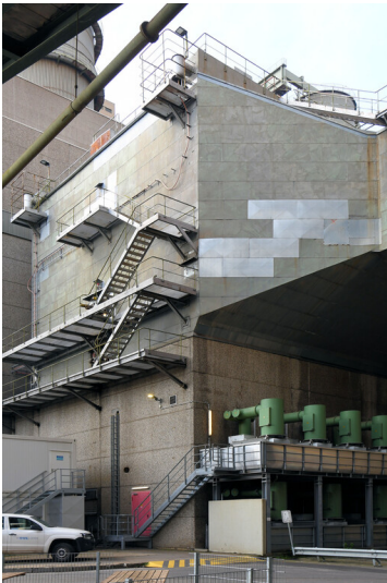
Kraftwerk Neurath: Elektrofilter Block A, Ansicht von Nordosten; Foto: 12.09.2023